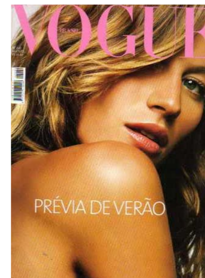
Vogue, November 2003