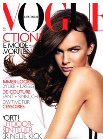
Vogue, Mai 2004