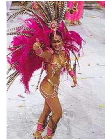
Juliana Paes im Carnaval do Rio 2004 49