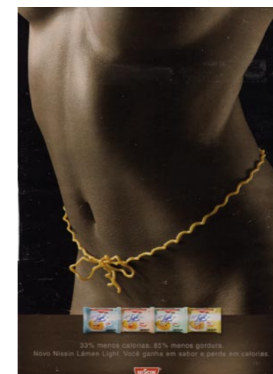
Caras, November 2003