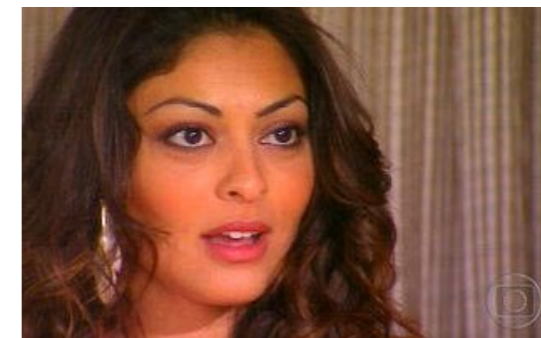
Juliana Paes in der Novela "Celebridade" 48