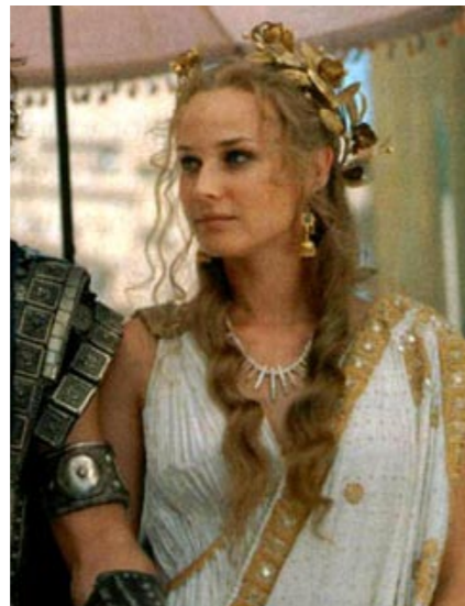
Diane Kruger in der Hollywoodproduktion "Troja" von 2003 43

Schönheitsideale sind vom Sockel gestiegen und dabei durch ihre allgemeinere Erreichbarkeit umso relevanter geworden. Ideal meint heute nicht mehr das "unerreichbar Vollkommene", das "wie auf berühmten Botticelli-Gemälden Venus oder Frühling" 42 hieß, sondern es wird seine Erreichbarkeit suggeriert. Dies ist in Brasilien